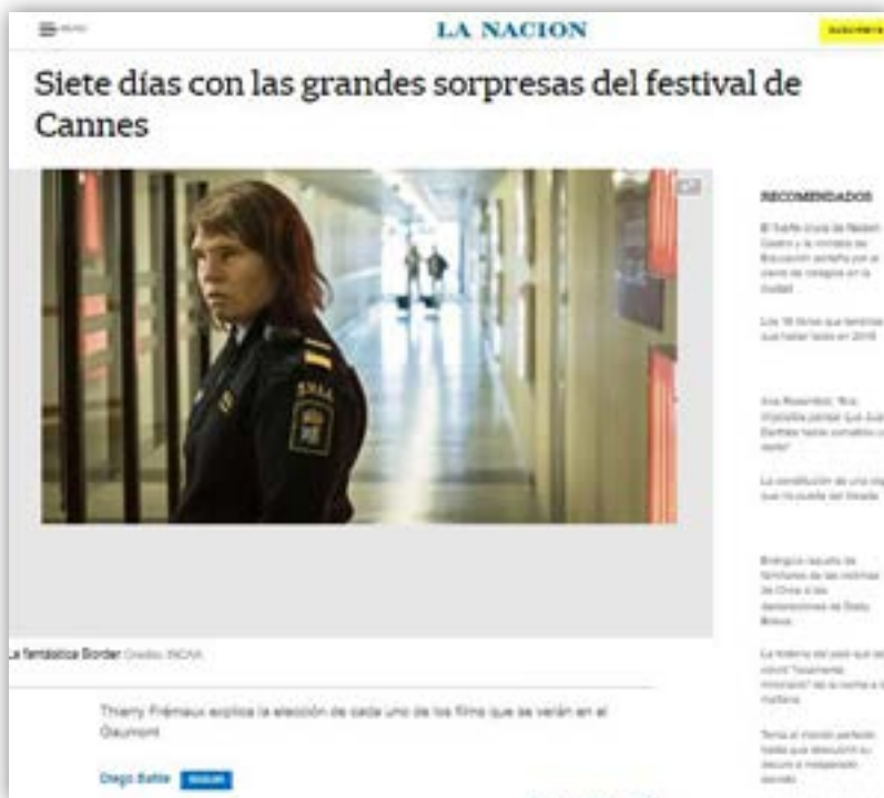
MEDIO: LA NACIÓN > LINK