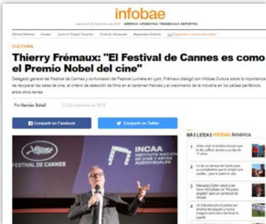
MEDIO: INFOBAE > LINK